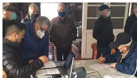
Círculo de Sof. en retiro Pta. Arenas