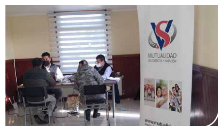
IV Brigada Aérea.