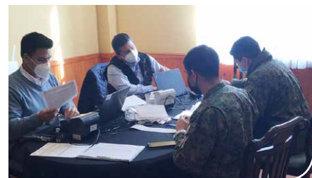
Regto. Infantería N°10 Pudeto.